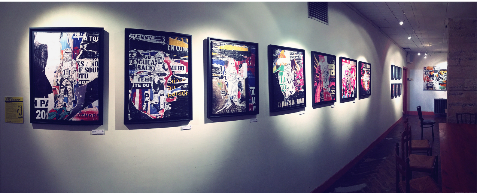
The troopers (serie) 46x61 cm/18x24 inch Technique mixte/mixed media Exposition à l'atalante (Bayonne) Exhibit at l'atalante (Bayonne) 2017/2018