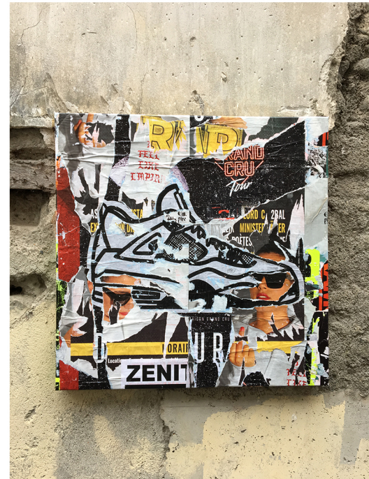
Air Jordan 4 step by step 80x80 cm/31.5x31.5 inch Technique mixte/mixed media 2017