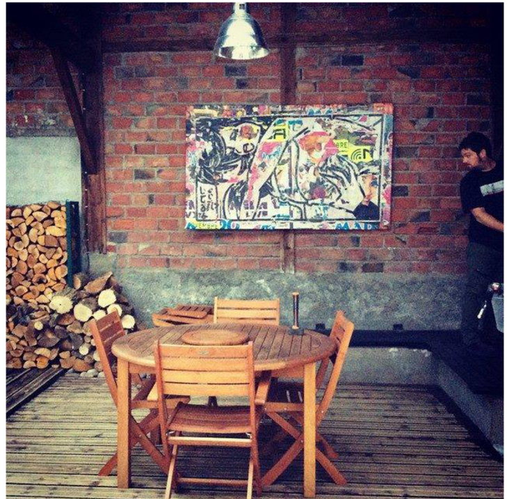
Dans la chaleur de la nuit/In the heat of the night 200x120 cm/78x47 inch Technique mixte/mixed media 2014