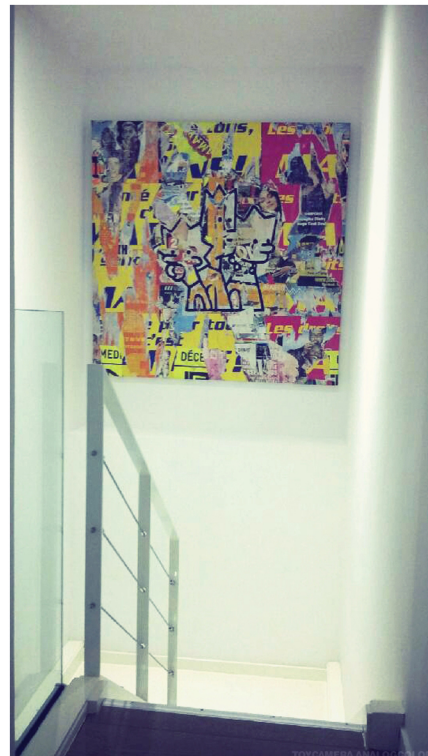
Bart and Co 150x150 cm/60x60 inch Technique mixte/mixed media 2016