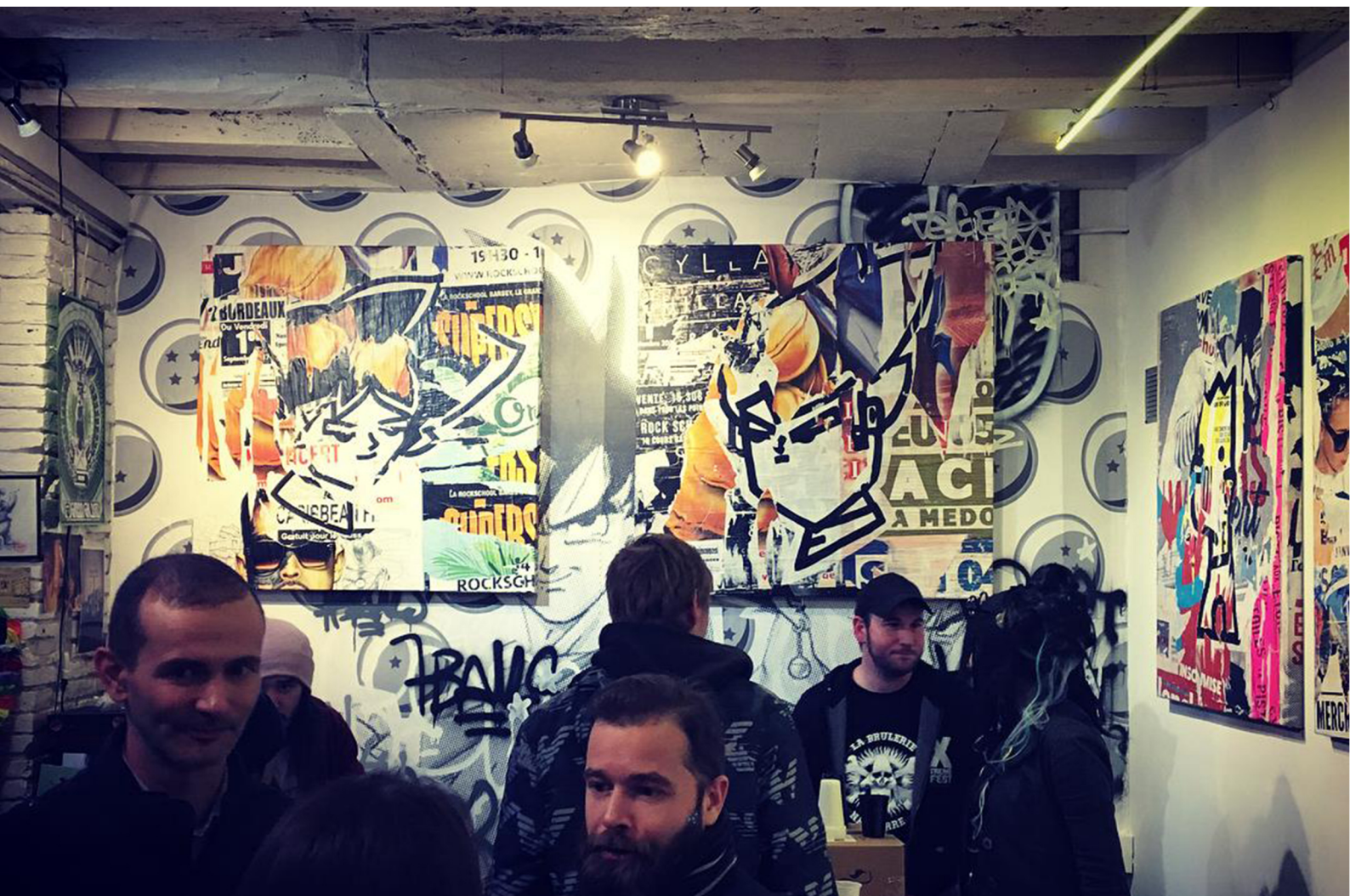
Street Goku & Street Vegeta 100x100 cm/39x39 inch Technique mixte/mixed media Exposition à la green galerie (Toulouse) Exhibit at la green galerie (Toulouse) 2018